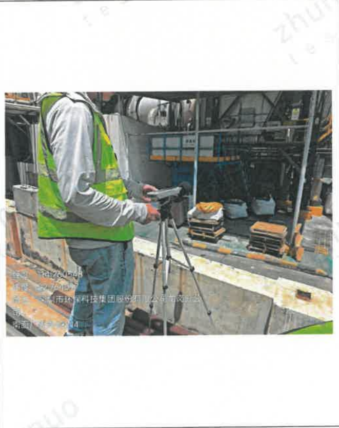
昼间-南面厂界外 1 米 N 4