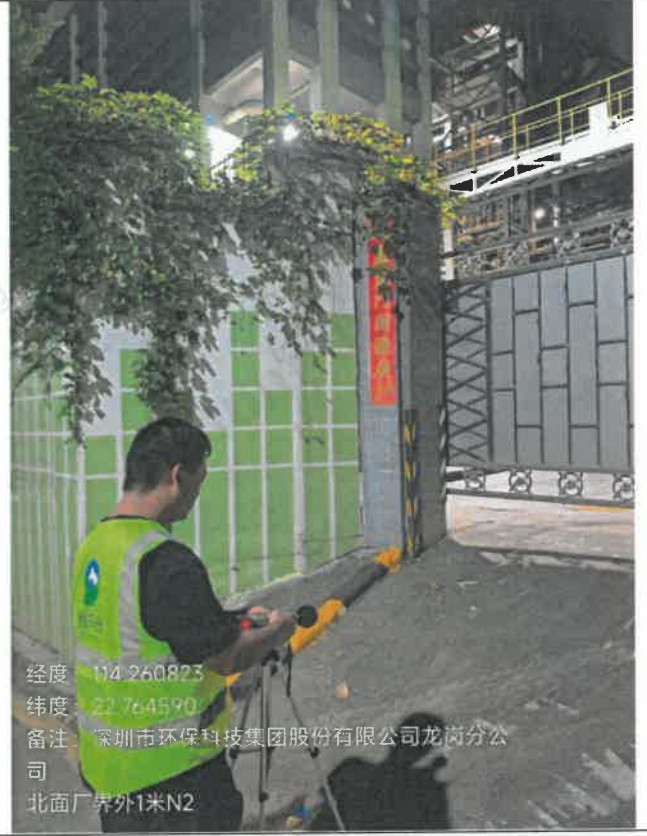
夜间-北面厂界外 1 米 N 2