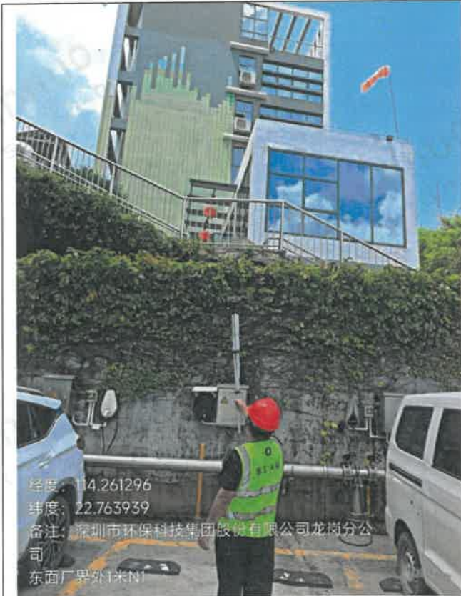
昼间-东面厂界外 1 米 N 1