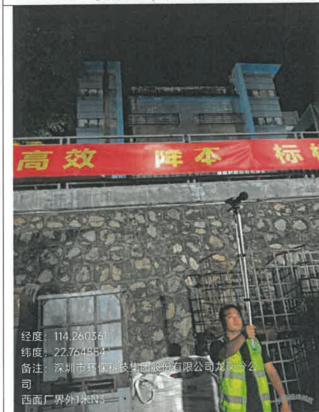
夜间-西面厂界外 1 米 N 3