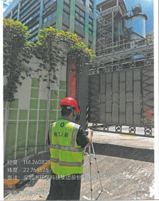
昼间-北面厂界外 1 米 N 2