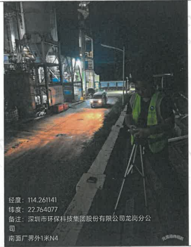
夜间-南面厂界外 1 米 N 4