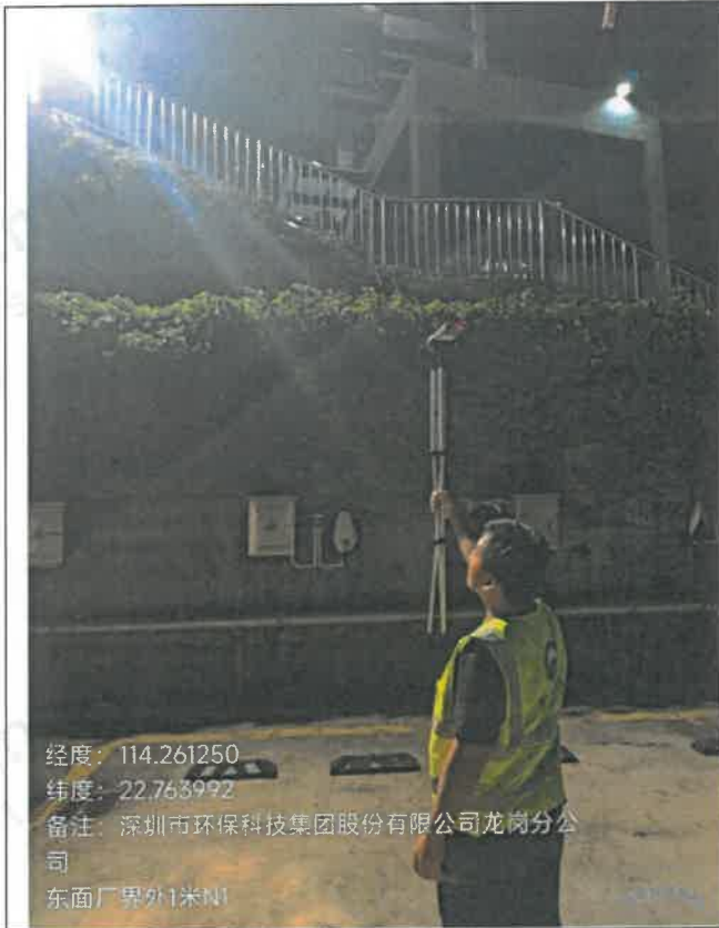
夜间-东面厂界外 1 米 N 1